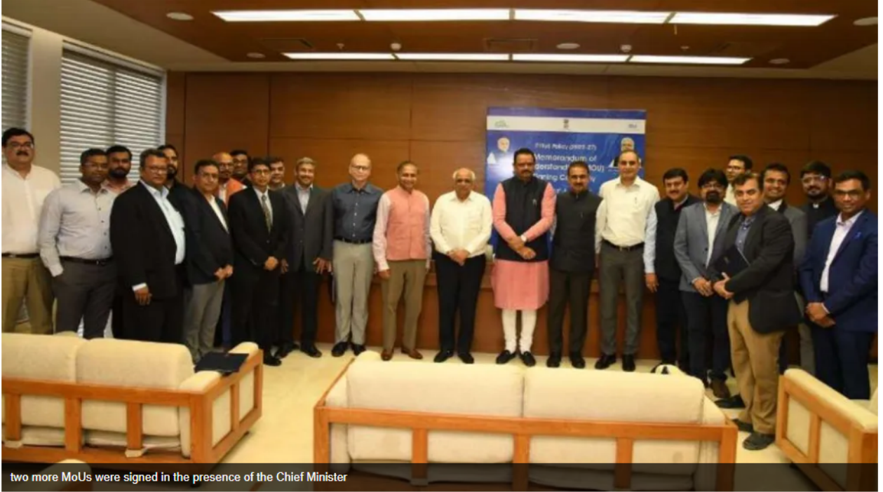
two more MoUs were signed in the presence of the Chief Minister

આ MoU મુબજ GESIA એસોસિયેશન રૂ. 2000 કરોડનું રોકાણ આગામી પાંચ વર્ષમાં કરશે અને અંદાજે 6700 લોકોને રોજગારીના અવસર મળશે. આ ઉપરાંત ઇન્ટીગ્રીટી ગ્રુપ રૂ. 100 થી 150 કરોડનું રોકાણ કરીને 3 હજાર જેટલી રોજગારીની તકો પૂરી પાડશે.