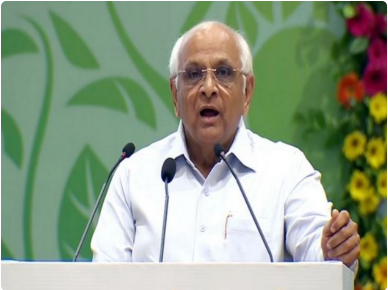
Gujarat chief minister Bhupendra Patel