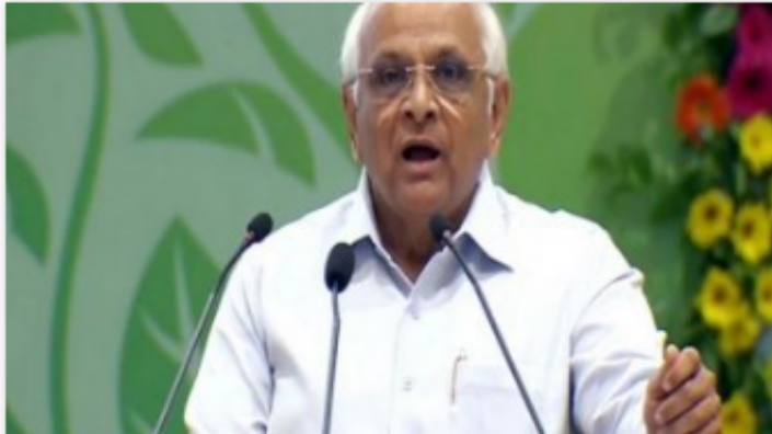
Gujarat Chief Minister Bhupendra Patel

Gandhinagar, June 21: The Gujarat government signed various memorandums of understanding worth more than Rs 2,000 crore on Monday in the presence of Chief Minister Bhupendra Patel, Education, Science and Technology Minister Jitu Vaghani and others.